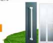
バリアフリー改修工事